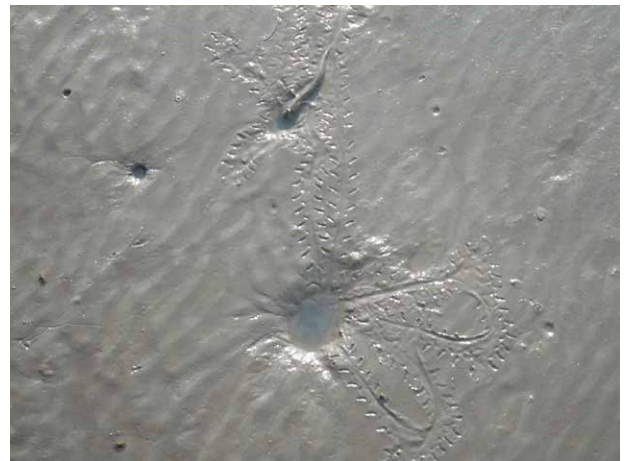
写真7 干潟のアーティストムツゴロウからの平和のメッセージ

分断・対立・紛争の絶えない世界が広まる中で、ムツゴロウはその風貌と言ひ、無尽蔵の付着珪藻類をついばみ、のんびりとした干潟の暮らしと言ひ、私たちに多くのメッセージを送ってくれています。ムツゴロウは森里海がつながる世界の生き証人のような存在です。彼らの食料、泥の表面に生きる付着珪藻類は、太陽光、水、二酸化炭素、栄養塩類、微量元素によって増殖し、干潟を緑の草原にしています(佐藤、2014)。森里海がつながる世界は平和の源であることをよく知っているようです。彼らの平和のメッセージをしっかりと受け止めたいものです(写真7)。