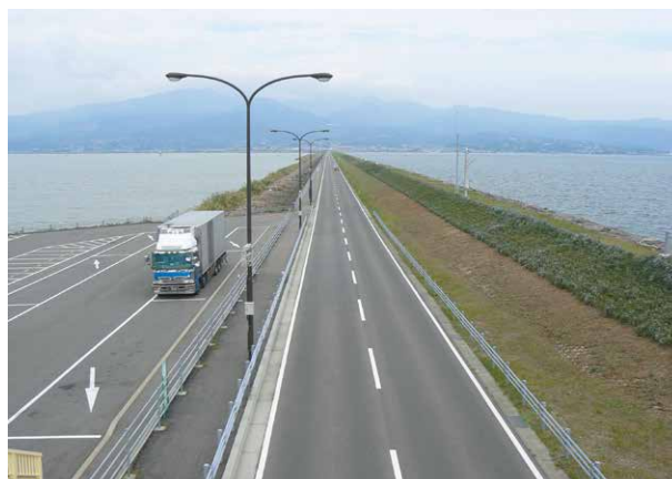
写真4 諫早湾奥部の広大な泥干潟を干拓するために建設された全長7kmの潮受け堤防