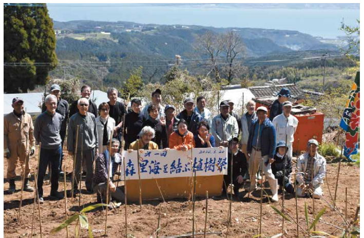
写真6 2020年3月20日に多良岳中腹で開催された第1回森里海を結ぶ植樹祭