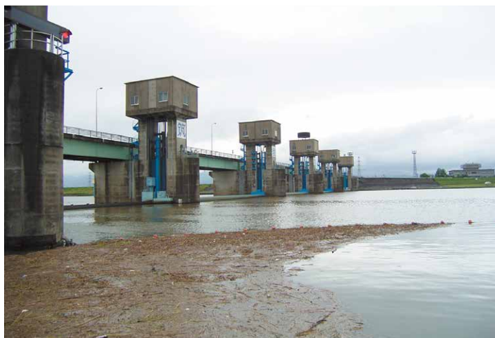
写真3 1985年に筑後川河口から23km上流に、福岡都市圏に水を送るために建設された筑後大堰