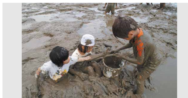
写真2 諫早湾奥部の干潟はアゲマキなどの生き物の宝庫として地域の暮らしを支えた