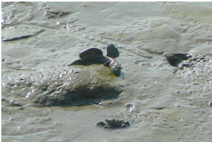
写真1 干潟上のムツゴロウ：ひとの営みをどのように見ているだろうか

た諫早湾奥部の広大な泥干潟は、「ムツゴロウが大事か、人間が大事か」との“踏み絵”を漁民に強要し、1997年4月14日に世界を震撼させた293枚の鋼板の連続的な落下により締め切られ埋め立てられました。それから四半世紀の時流れ、今では環境・経済・社会の間に見られるトレードオフ関係を克服して、協調相乗効果の関係への転換が地球的課題の解決の基軸であることが明らかになってきました。ムツゴロウを大事にすれば、人間の地域経済もうまく回るとの価値観が問われています(写真1)。