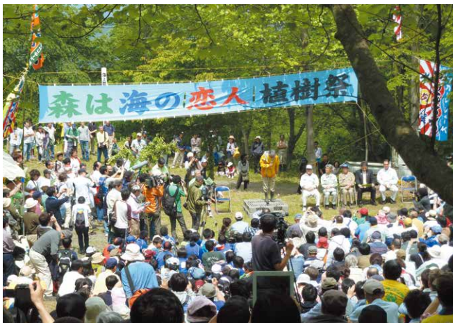
写真5 岩手県一関市で毎年6月に開催される「森は海の恋人」植樹祭

有明海の再生を担う潮受け堤防開門問題のみに近視眼的に捉われていては未来世代への思いは生まれてきません。森は海の恋人運動のように、一度山に登って諫早湾全体を