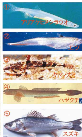
図1 有明海の全景と代表的な特産的魚類